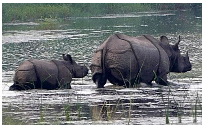
2016 Parc de Bardia Népal

Les 3000 rhinocéros asiatiques se partagent entre les parcs de Chitwan et de Bardia au Népal et celui de Kasiranga en Inde. Seulement quelques