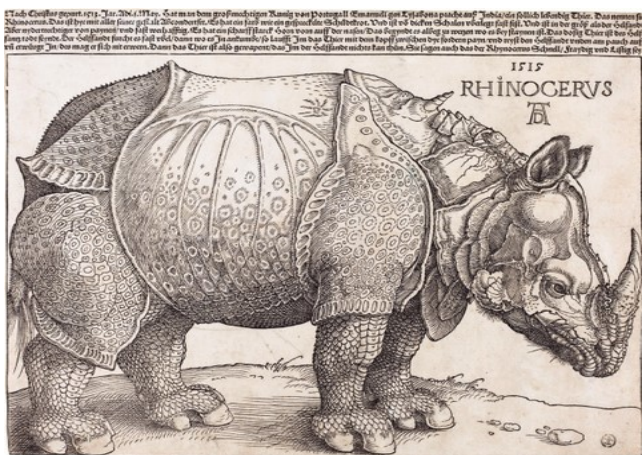
1515 Dürer, Rhinoceros , gravure sur bois, 21,4 x 29,8 cm , British Museum

La même année, à Nuremberg, apparaissent deux gravures sur bois, celle de Burkmaier, mais surtout l'exceptionnel « Rhinocéros de Dürer ». Comment ces deux graveurs ont-ils eu connaissance des éléments anatomiques suffisamment précis pour réaliser leur œuvre ?