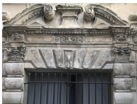
Porte à fronton et volutes de l'hôtel de Buous-Pontevès à Apt.