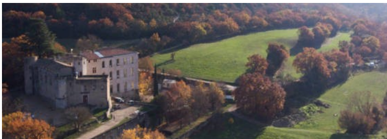
Quelques images anciennes et récentes du château de Buoux à peu de distance d'Apt, nommé le château de l'environnement.

occupaient à cette époque une haute situation sociale et possédaient une fortune considérable. Il demandait à être enseveli dans la tombe de ses ancêtres aux cordeliers d'Apt(1) » Leur descendance est nombreuse, un fils et sept filles.